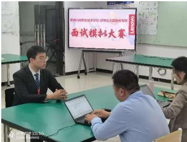
就业指导优秀个人