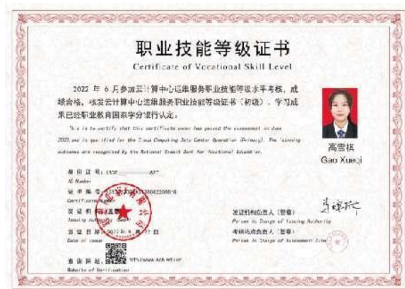
1+X 云运维技能等级证书